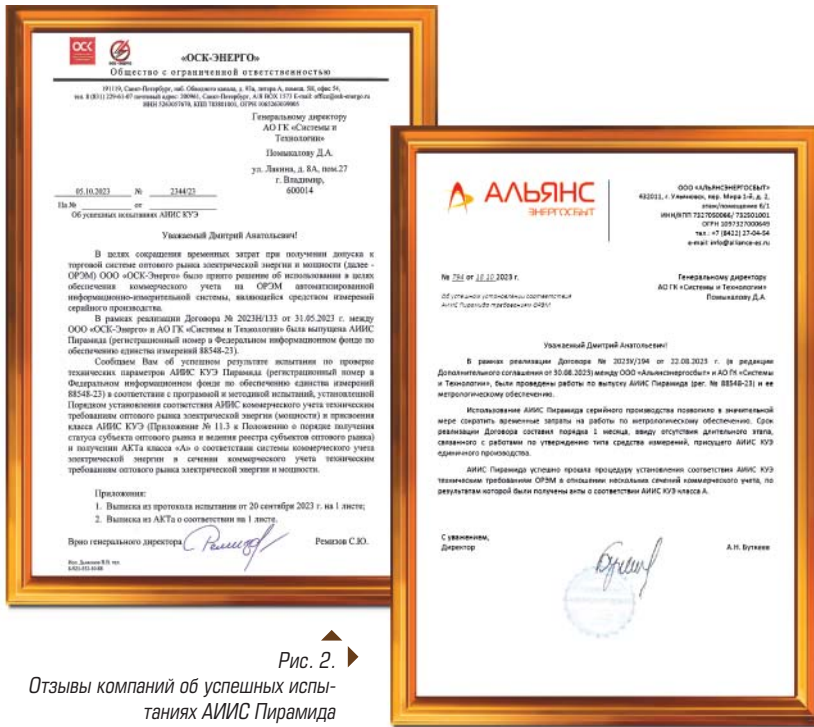
Рис. 2. ▶ Отзывы компаний об успешных испытаниях АИИС Пирамида

Одними из первых компаний, применивших АИИС Пирамида для осуществления коммерческого учета на ОРЭМ стали компании ООО «ОСК-Энерго» и ООО «АЛЪЯНС-ЭНЕРГОСБЫТ». На сегодняшний день данными компаниями были получены акты о соответствии класса А в отношении сечений коммерческого учета.